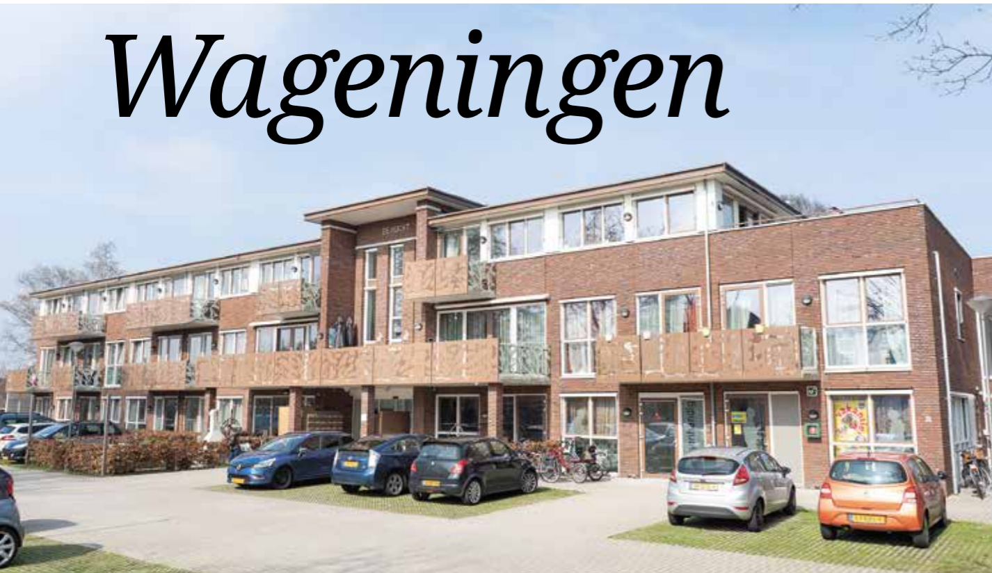
Generaal Foulkesweg (De Hucht)